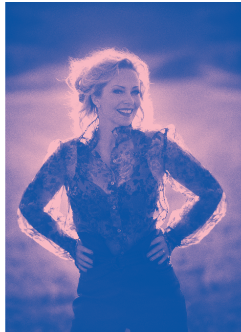
Beeld: Mark Uyl

Anneke van Giersbergen treedt op 28 oktober twee keer op. Kijk voor de actuele informatie op ongekendnijmegen.nl