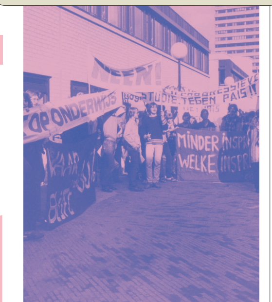
Demonstratie tegen bezuinigingen, 1978.