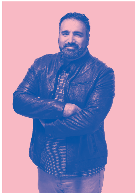
Beeld: Michael Schnater